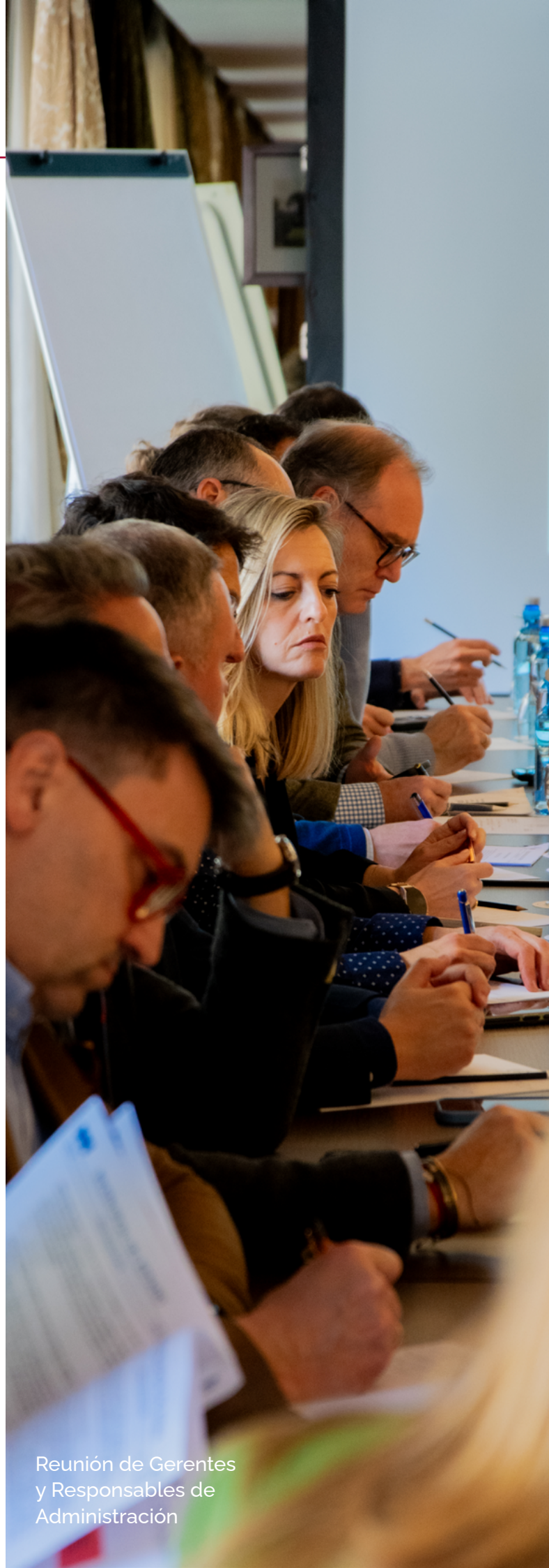
Reunión de Gerentes y Responsables de Administración