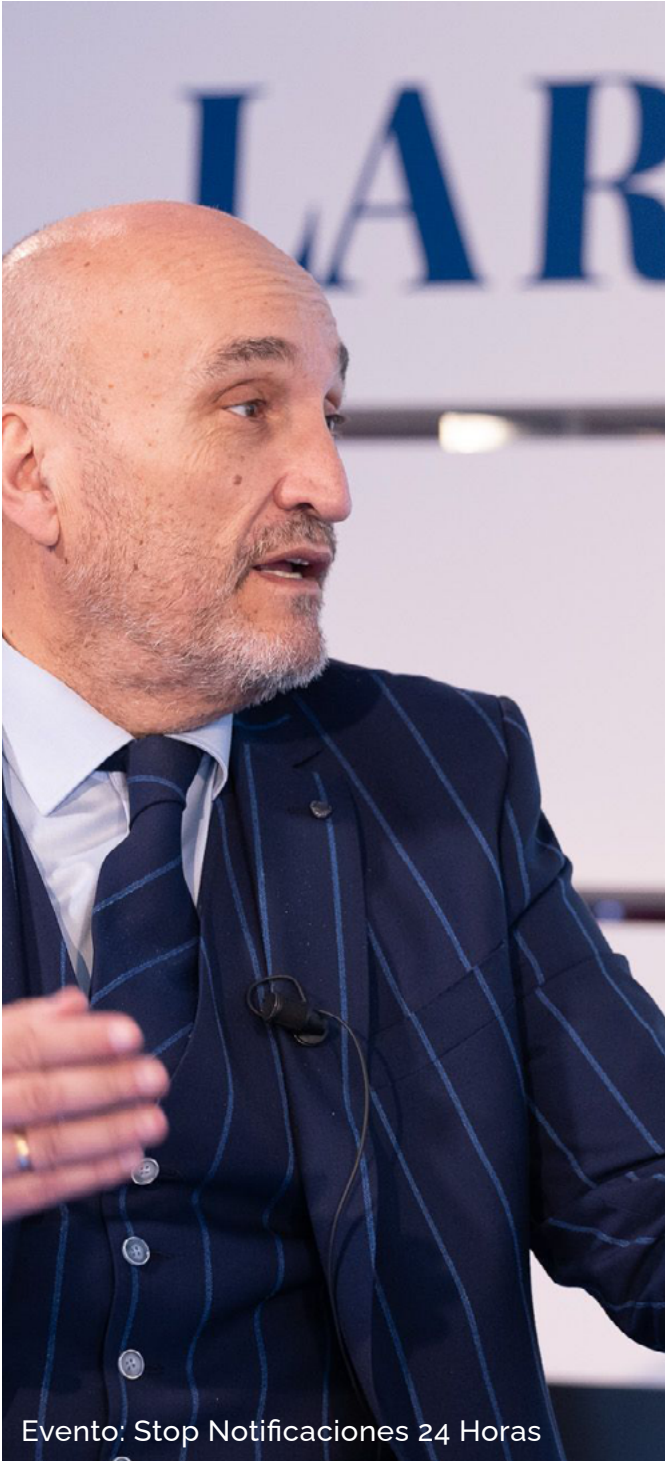
Evento: Stop Notificaciones 24 Horas

Se trata de actos o eventos que tienen un carácter fundamentalmente institucional y en la que miembros del Consejo General asisten en representación de la profesión. Seguidamente, se relacionan de forma resumida los eventos más importantes en los que ha participado el Consejo General durante el año 2025.