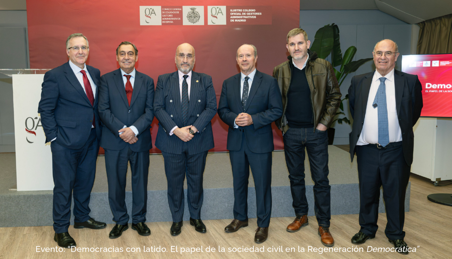
Evento: "Democracias con latido. El papel de la sociedad civil en la Regeneración Democrática"