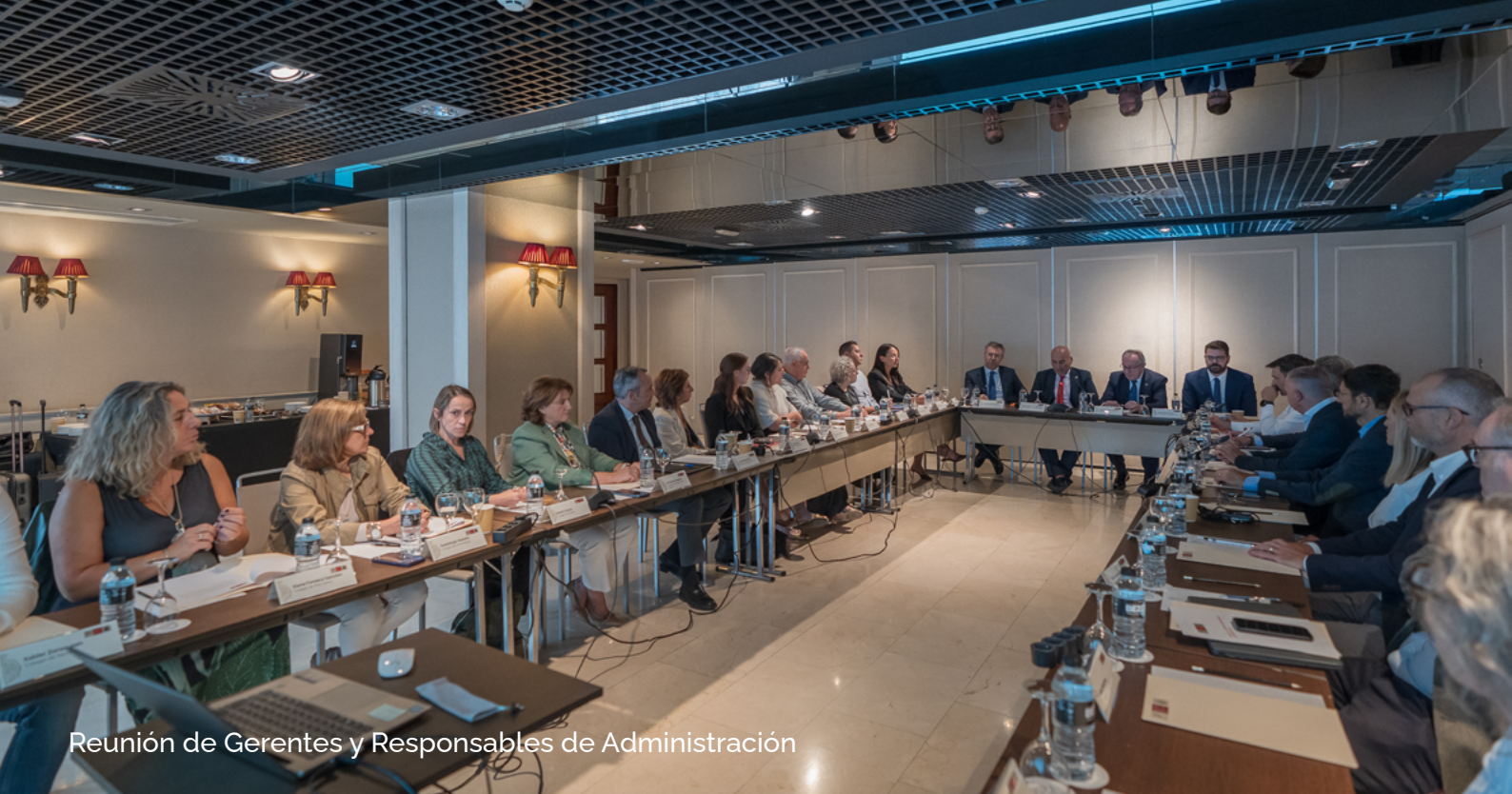
Reunión de Gerentes y Responsables de Administración